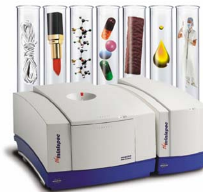
Figur 2. Minispec mq series lavfelt NMR instrument (Bruker Optik GmbH, Tyskland)

En annen fordel med NMR-metoden er at NMR-signaler er lite følsomme for små variasjoner i mikroskopiske egenskaper ved råvarene i fôret. Derfor har råvarenes opprinnelse – som for eksempel fiskeoljers opprinnelse – ingen vesentlig innvirkning på de observerte NMR-signalene. Hyppige kalibreringer er derfor ikke nødvendig.